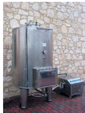
Note: (1), (2), (3) a pag. 26 del catalogo generale. Notes (1), (2), (3) on page no. 26 of the general catalogue.